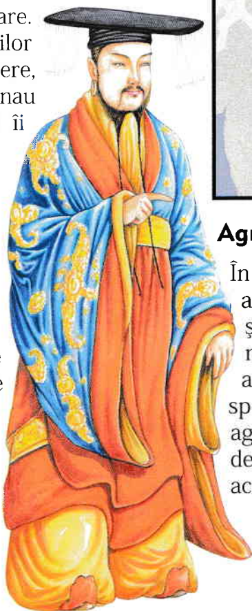
◉ Împăratul Tang

Primele documente ale istoriei chineze au fost create în această perioadă. Acestea sunt reprezentate de inscripții pe oase de animale și bucăți de carapace de broască țestoasă, numite oasele-oracol. În timpul acestei perioade au fost create mai mult de 3.000 de caractere ale scrierii chinezești.