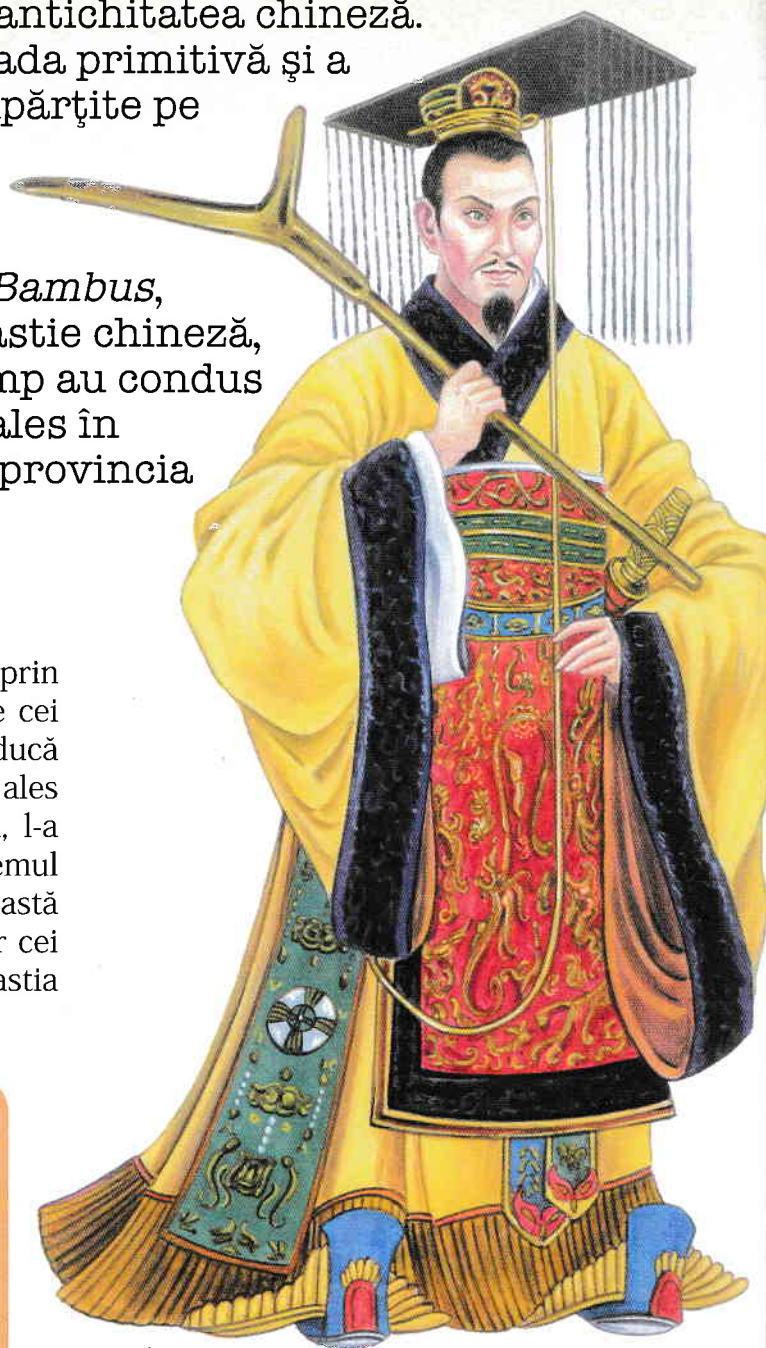
• Împăratul Jie, ultimul conducător din dinastia Xia

Numiți unul dintre principalele izvoare ale istoriei chineze.